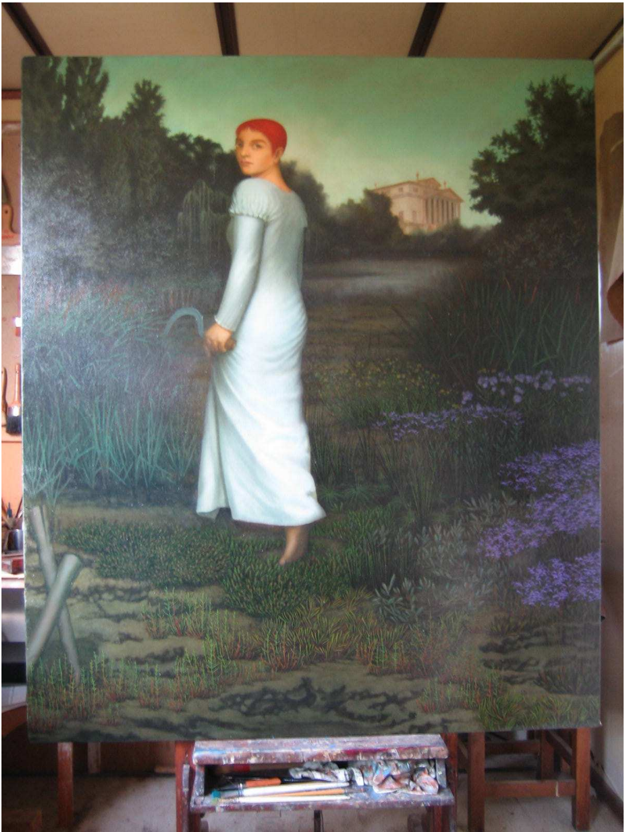
“Omaggio a Malcontenta” di Marco Gazzato, olio su tela, 138x164 cm., marzo-maggio 2008